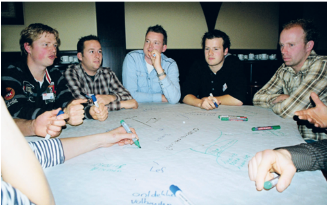
Ondernemerskwaliteiten in beeld, de eerste grote workshop waarbij kernbegrippen rond ondernemen op een tafelkleed werden geschreven

maken: word ik ondernemer of niet? Past dat wel bij mij? Wat zijn mijn kwaliteiten en capaciteiten? Jongeren willen na het onderwijs weten wat je moet doen om een goede ondernemer te worden. Op school doen studenten vooral theoretische, algemene kennis op over het ondernemerschap. Na school rijzen de vragen: Hoe ga je om met personeel? Wat doe ik bij ruimtelijke ontwikkelingsprocedures? Dergelijke onderwerpen zijn onderbelicht in het groene onderwijs. Het zijn persoonlijke, op de eigen situatie toegespitste vragen waar wij jongeren graag bij helpen door middel van ons coachingsprogramma. Wij begeleiden jongeren, leren ze welke stappen ze moeten nemen in het ondernemerschap en waarmee ze rekening moeten houden. Met als doel het ondernemerschap bij afgestudeerden te ontwikkelen en stimuleren.”