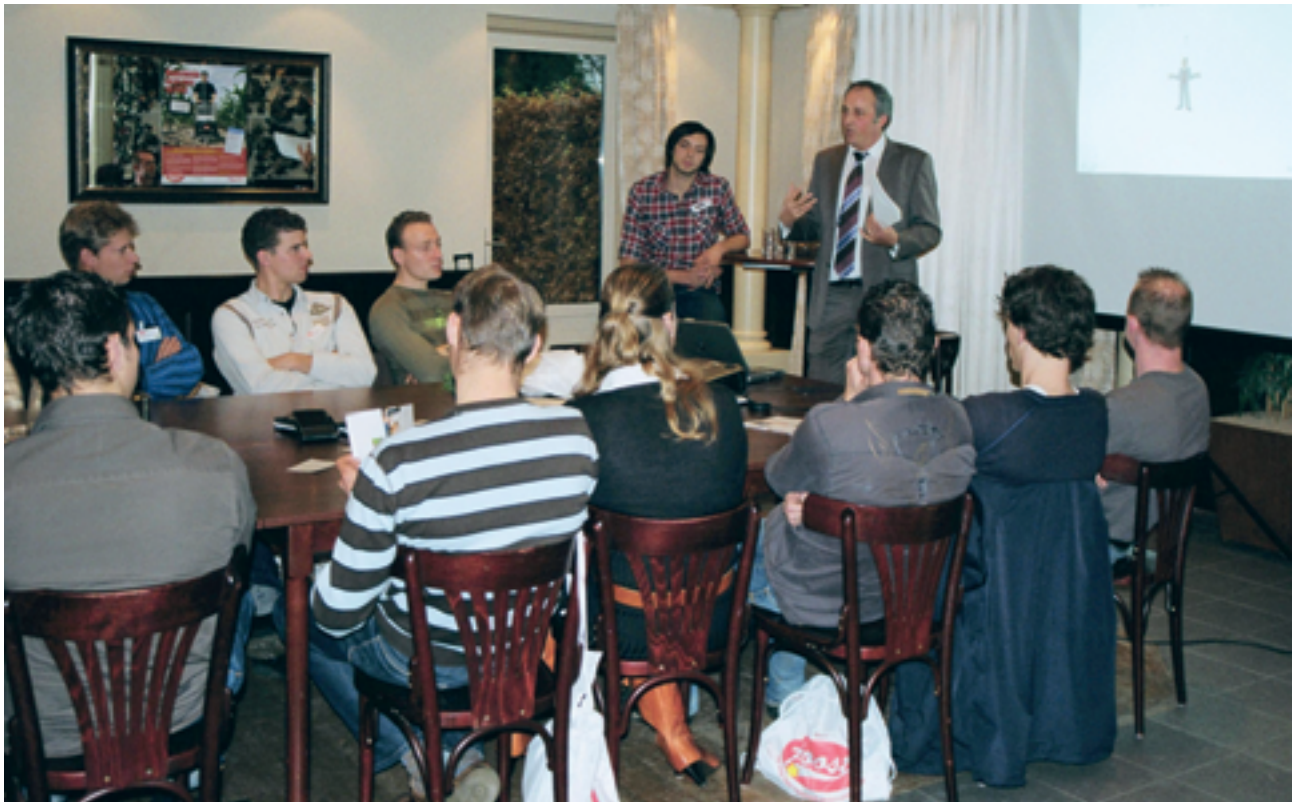
De Rabobank verzorgde ook een workshop en vertelde waaraan potentiële bedrijfsopvolgers moeten denken wanneer ze het bedrijf van hun ouders overnemen

onderwijs. Toen mijn vader wethouder werd, wilde ik het bedrijf overnemen. Ik wilde dat al vanaf mijn jeugd. Op de HAS leerde ik vaardigheden die je nodig hebt voor een eigen bedrijf. Je krijgt er de ruimte je te ontwikkelen als ondernemer. We deden rollenspellen om te leren communiceren. En we gaven boeren adviezen over problemen uit de praktijk. Door zulke projecten en de stages werden we geprikkeld verder te kijken dan wat de opleiding biedt. Maar het verschil tussen JOOST en het onderwijs is dat je op school aan de criteria van school moet voldoen. Daar zijn algemene doelen aan verbonden. Bij JOOST stel je je eigen doelen en je wordt gecoacht om die te halen. Je maakt je eigen plan, het is een persoonlijker benadering. Toen mijn man en ik dit jaar het bedrijfsovernametraject ingingen, kwam er veel op ons af. Het bedrijf van mijn schoonouders en dat van mijn ouders worden samengevoegd, iets wat grote juridische en financiële consequenties heeft. JOOST heeft bij het tra-