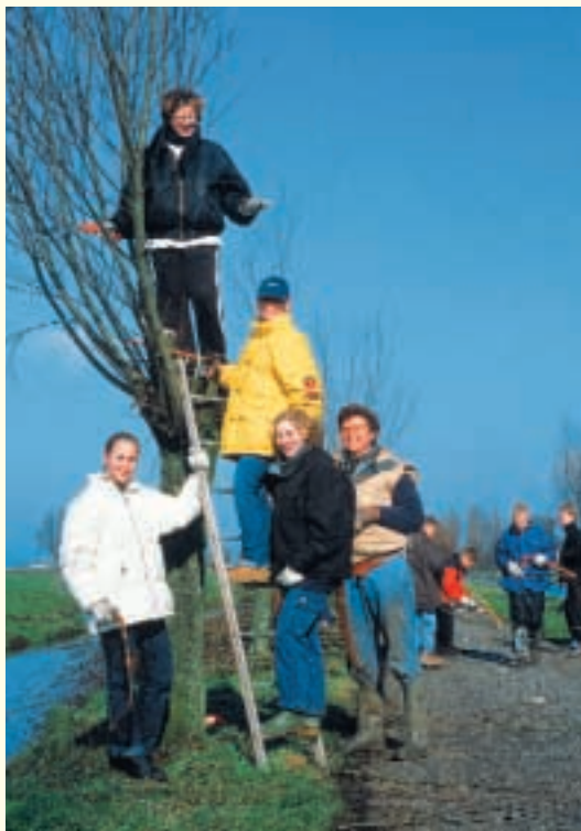
Scholieren knotten langs het fietspad Houtdijk

Tijdens de lessen biologie, aardrijkskunde en techniek is aandacht besteed aan het