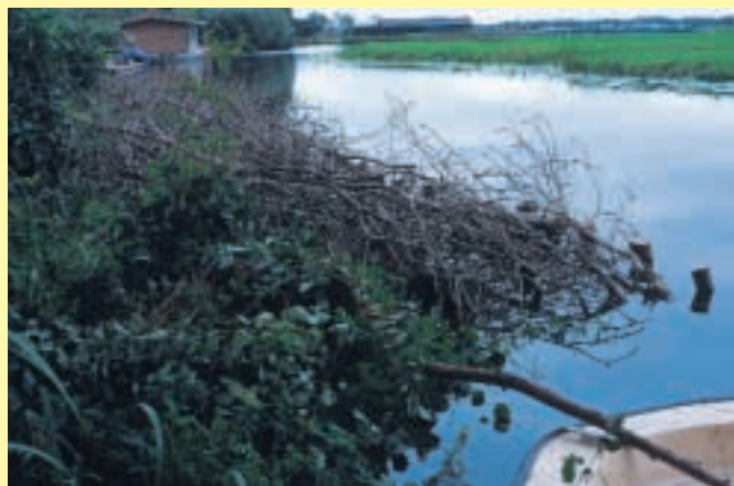
Versteviging van de oever met vrijgekomen hout